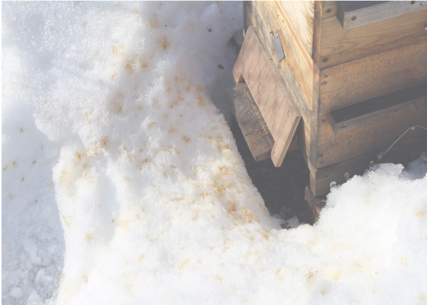
Ruche warré avec planchette